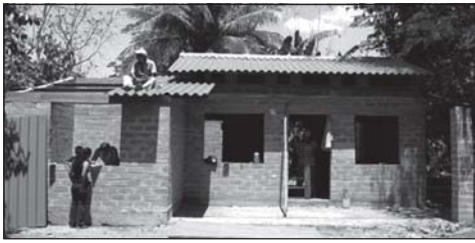
Vivienda rural adaptada a Trópico Húmedo