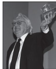
Arq. Richard Meier